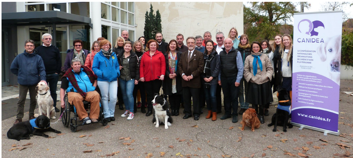
Participants des canidéennes 2019

Les commissions ont dessiné leurs feuilles de route pour l'année à venir en prenant en compte les recommandations des ateliers. Accueillies par Handi'chiens dans son centre de Kunheim hébergé dans une maison de retraite, les canidéennes ont également été l'occasion de célébrer les 30 ans de cette grande association et se sont clôturées avec la cérémonie de remises des chiens d'accompagnement social à laquelle Handi'chiens avaient invité tous les participants. Pour plus de détail, les actes reprennent les grandes lignes des échanges qui ont eu lieu pendant ces deux intenses journées.