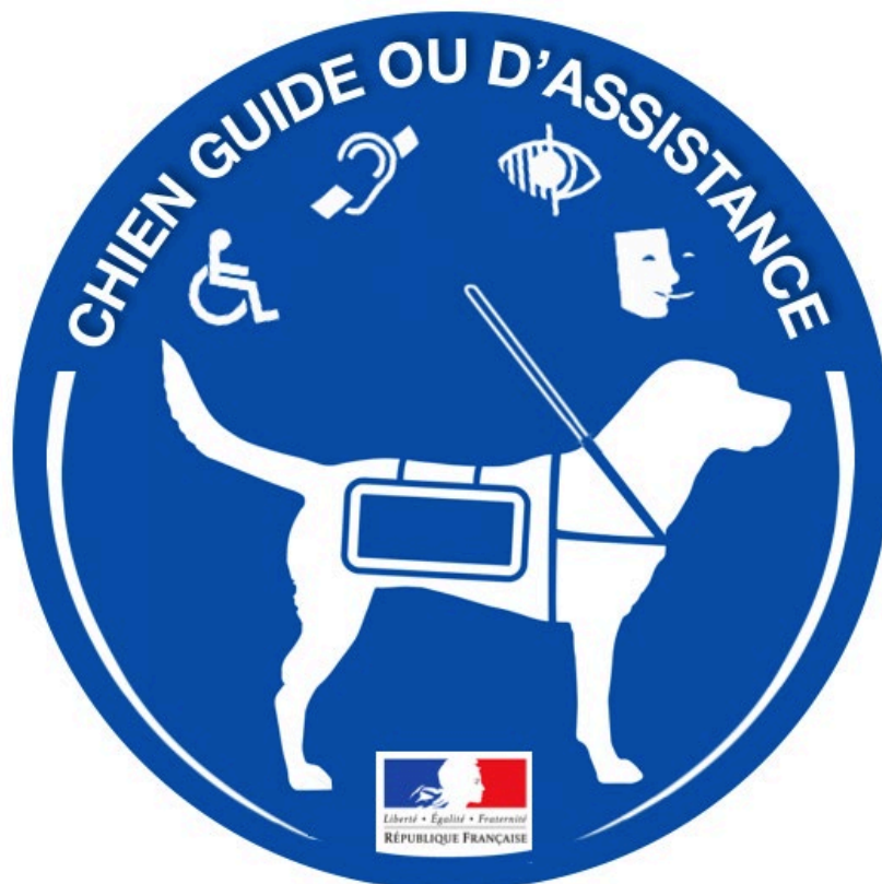
Macaron tel qu'il a été proposé et validé par le Secrétariat d'Etat à l'Accessibilité

Cette mission importante a un impact immédiat pour les personnes en situation de handicap car l'identification du chien comme chien d'assistance ou chien guide est un élément indispensable pour l'accessibilité. Ce macaron, qui n'existait pas et qui doit être déployé par CANIDEA en 2020, va permettre de diminuer le nombre de refus et donc de situations de discrimination pour les personnes en situation de handicap accompagnées par leur chien guide ou d'assistance.